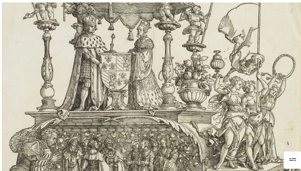
Triumphzug des Kaiser Maximilian I., Holzschnitt von Hans Burgkmair dem Älteren

Vielseitig und ambiguitätstolerant: Kaiser Maximilian I. war ein in vieler Hinsicht bemerkenswerter Herrscher. Ein Wiener Forschungsprojekt zeichnet ein glanzvolles Bild seines Hoflebens.